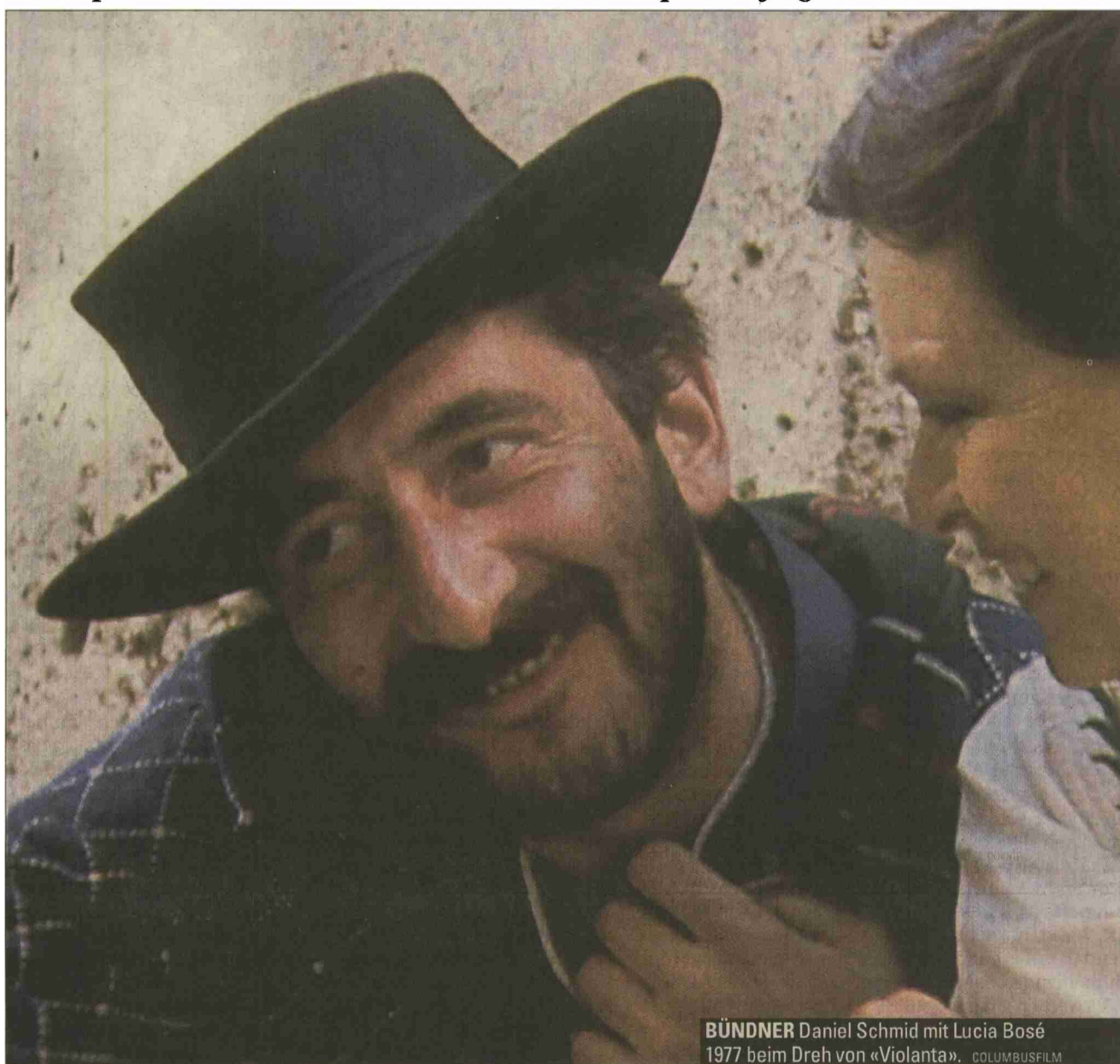
BÜNDNER Daniel Schmid mit Lucia Bosé 1977 beim Dreh von «Violanta».

Der Schweizer Dokumentarfilm ist stark wie noch nie und erlebt im In- und Ausland immer grössere Aufmerksamkeit. Gleich drei neue Dok-Filme kommen in den nächsten Tagen ins Kino: Zwei Porträts von Kulturschaffenden – dem 2006 verstorbenen Regisseur Daniel Schmid und dem Choreografen Heinz Spoerli – sowie ein erfrischender Film über Fussball spielende junge Frauen in Bern Bethlehem.